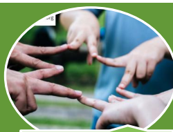
Les PEP 40 sur HelloAsso