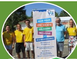
Focus sur nos séjours dans la presse locale