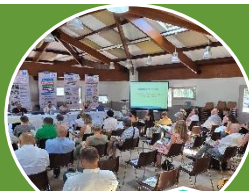
Retour sur l'AG 2025....